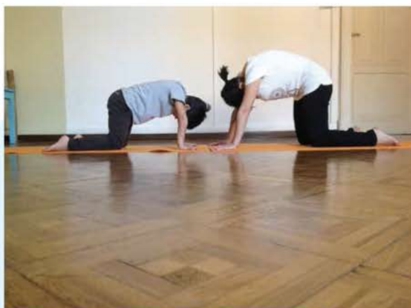
Figura 3: come un gatto mi stiro in giù