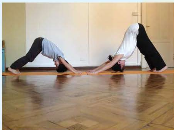
Figura 4: mi distendo come un cane a testa in giù

"I racconti dello yoga - la storia di Huddaian", I. Cocchi e F. Curzi, Macro ed.