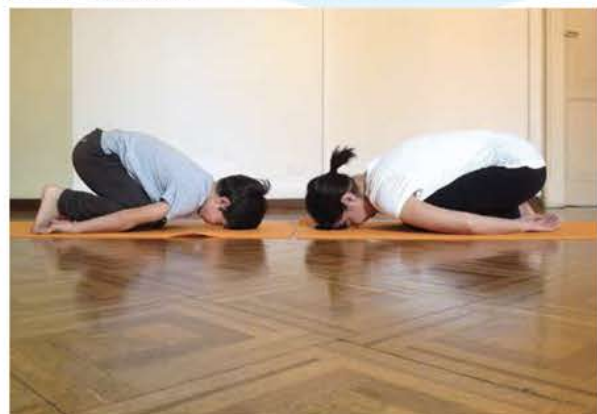
Figura 5: poi mi riposo come una foglia silenziosa

"I racconti dello yoga - gli animali del bosco", I. Cocchi e F. Curzi, Macro ed.