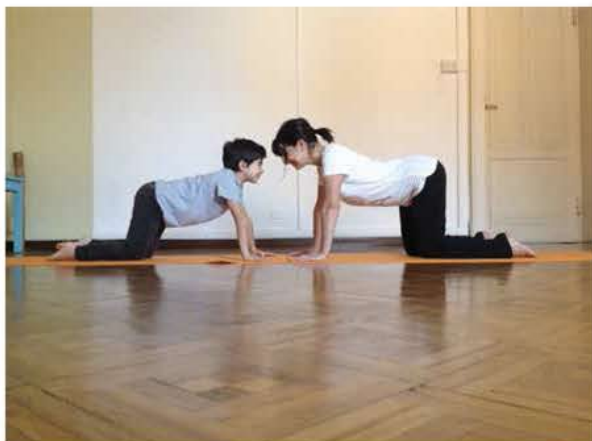
Figura 1: occhi negli occhi e ... iniziamo!