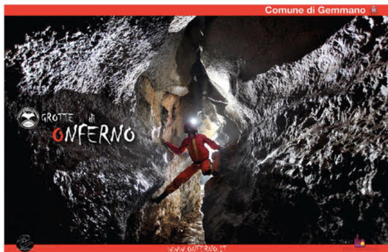
Comune di Gemmano