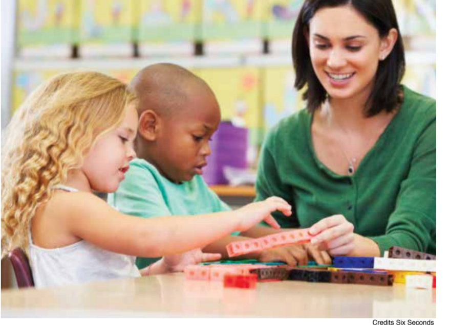
Credito Six Seconds

Come aiutare il bambino/a e il genitore/i a prendersi cura fin da piccoli dell'IE Tutto inizia da una nostra responsabilità come adulti. I bambini, infatti, ci guardano e seguono il nostro esempio. È importante parlare di emozioni in famiglia, dare loro spazio e far capire ai bambini che non esistono emozioni positive o negative .